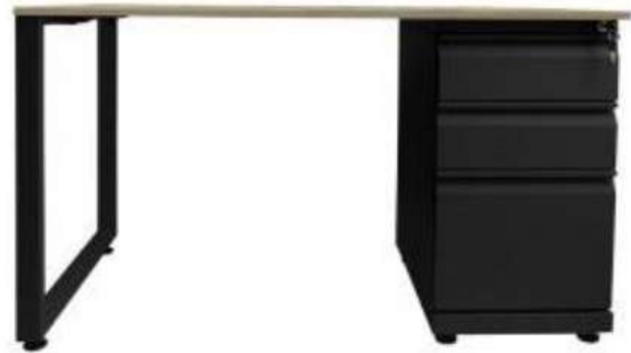
▶ Línea de escritorios