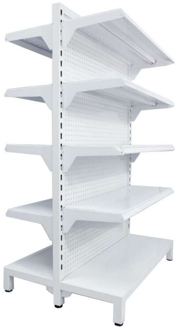
► Góndola central doble