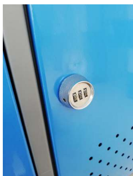
▶ Cerradura Combi-Cam