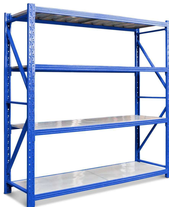
▶ Tendido en lámina galvanizada