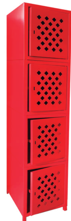
▶ Locker monolock apilable