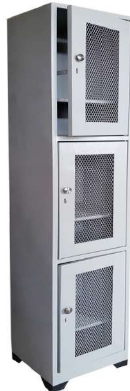
▶ Locker con puertas en malla