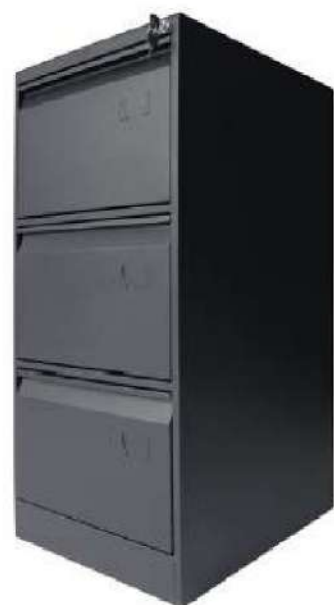
Archivador 3 Gavetas