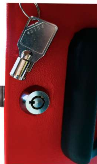
▶ Cerradura de bloqueo de leva