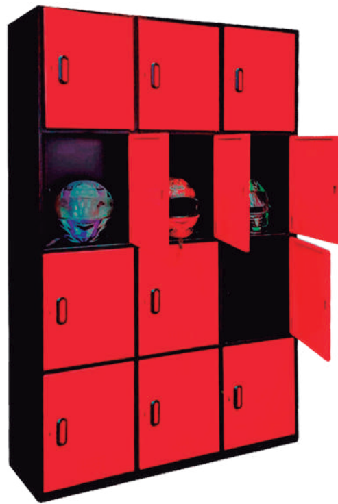
▶ Locker para cascos de motocicletas