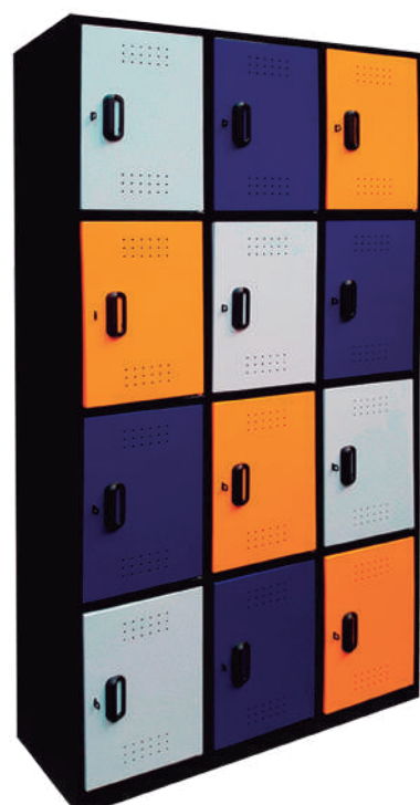
▶ Locker 12 puestos