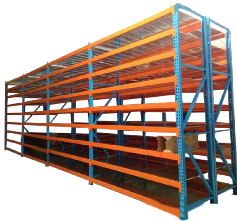
▶ Estantería semi-pesada