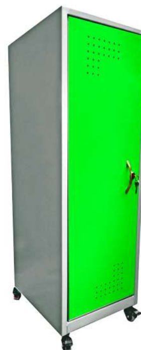
▶ Locker rodante