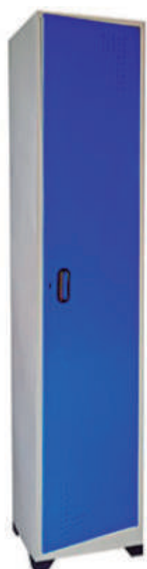
▶ Locker 1 puesto