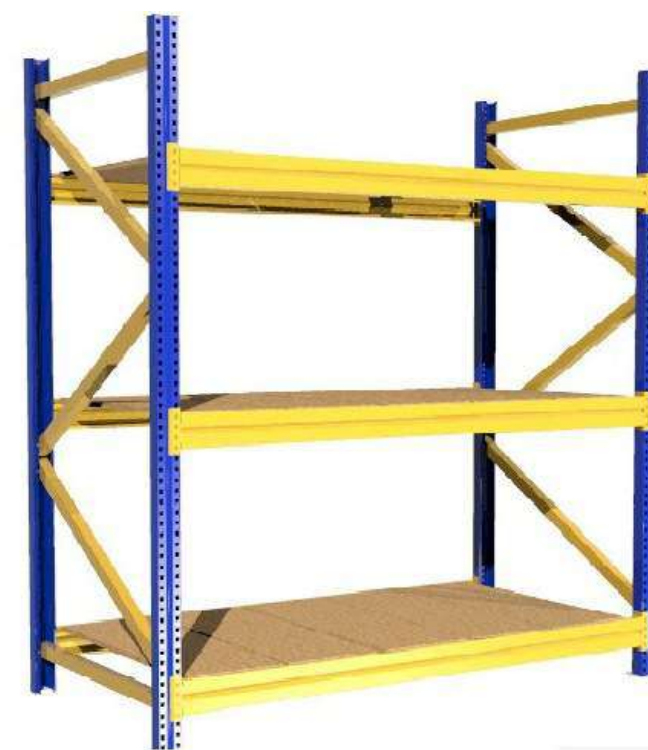
▶ Tendido en madera