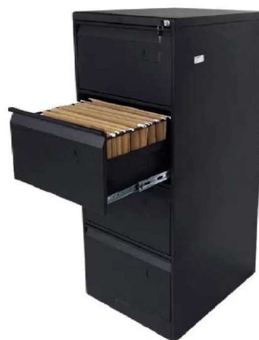
Archivador 4 Gavetas