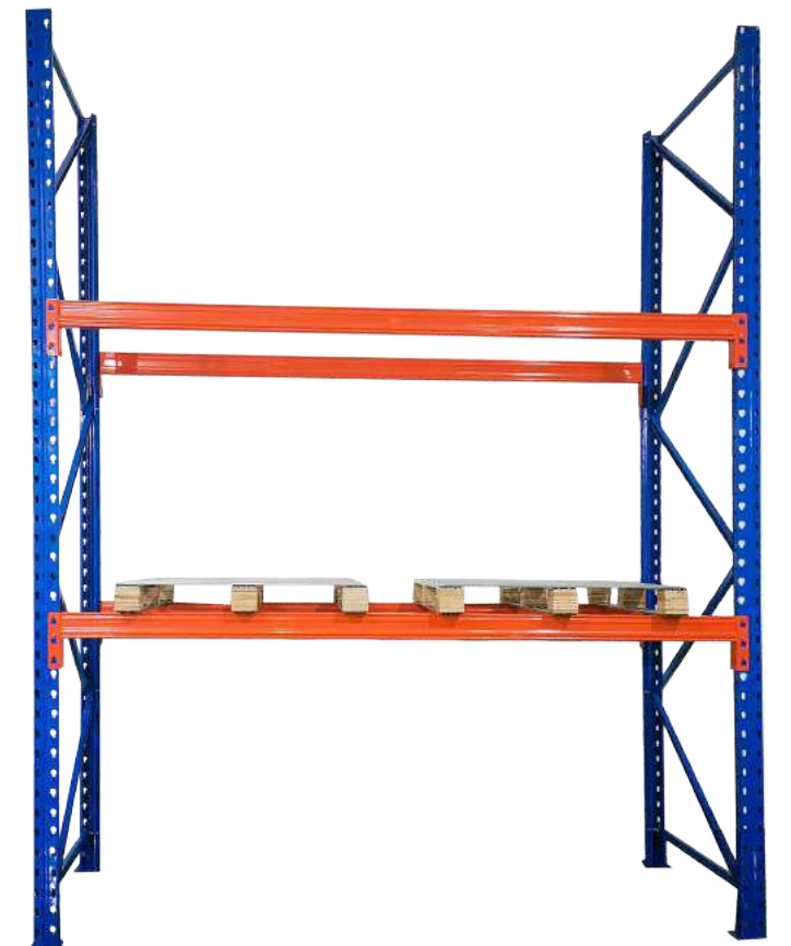
▶ Estantería pesada