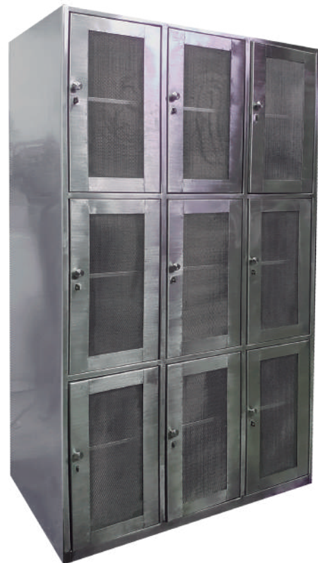
▶ Locker en acero inoxidable