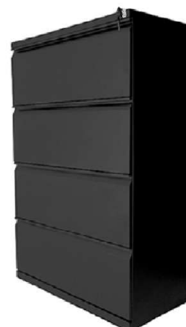
Archivador 4 Gavetas