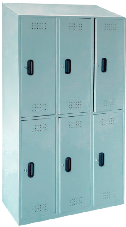
▶ Locker con techo inclinado