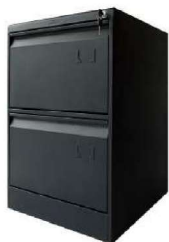
Archivador 2 Gavetas

Elaborado en lámina Cold Rolled Cal. 22 y chapa de seguridad.