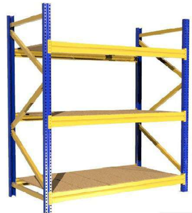
▶ Tendido en madera