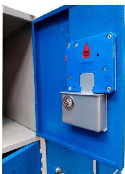
▶ Cerradura monedera