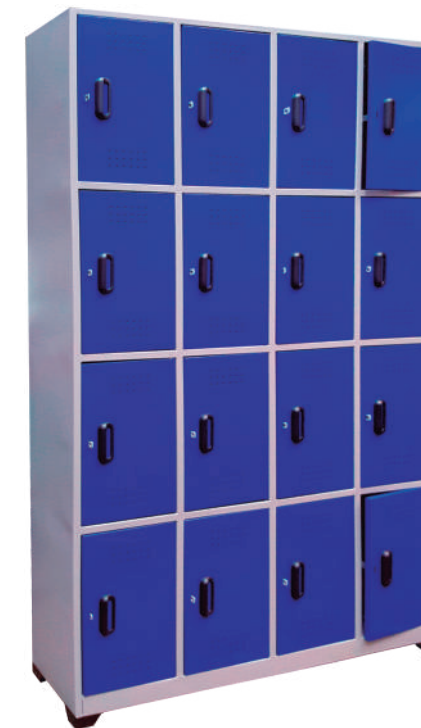
▶ Locker 16 puestos