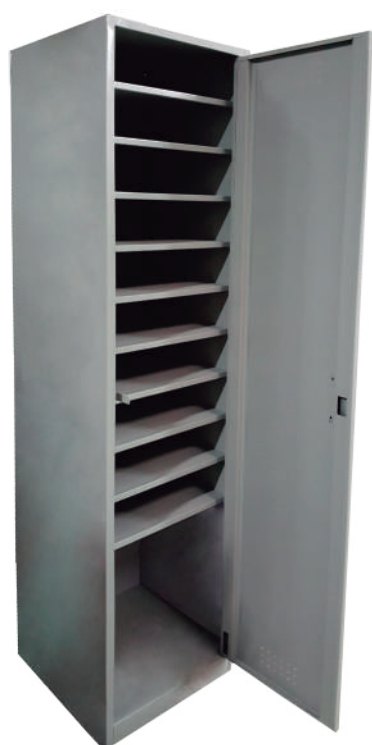
▶ Casillero para portátiles