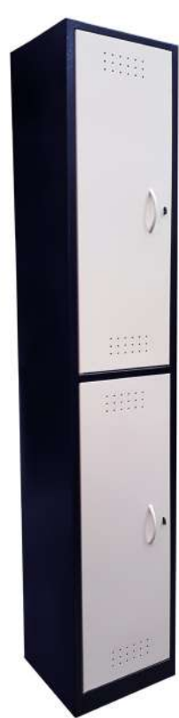
▶ Locker 2 puestos