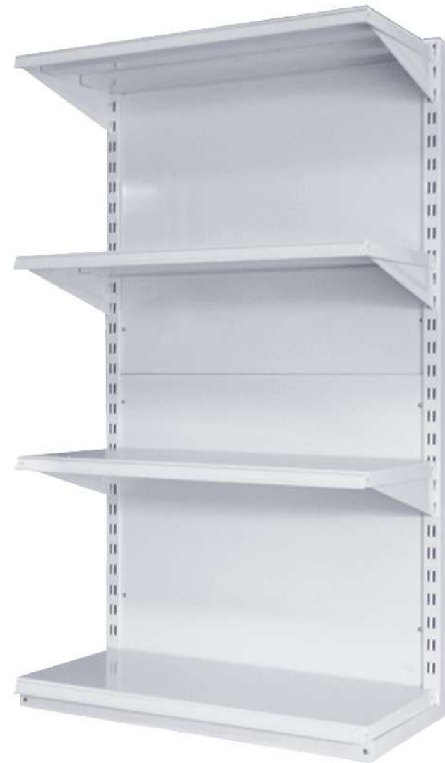
► Góndola de pared