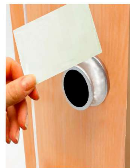
▶ Cerradura electrónica de proximidad