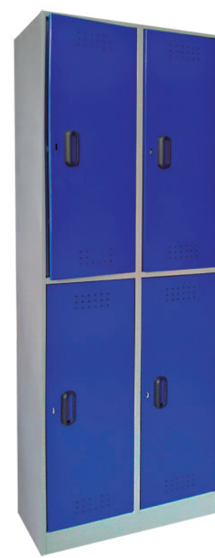
▶ Locker 4 puestos