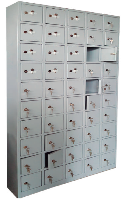
▶ Casillero para celulares