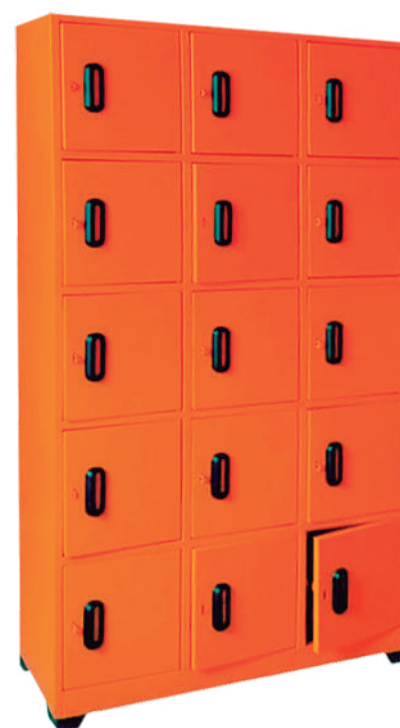
▶ Locker 15 puestos