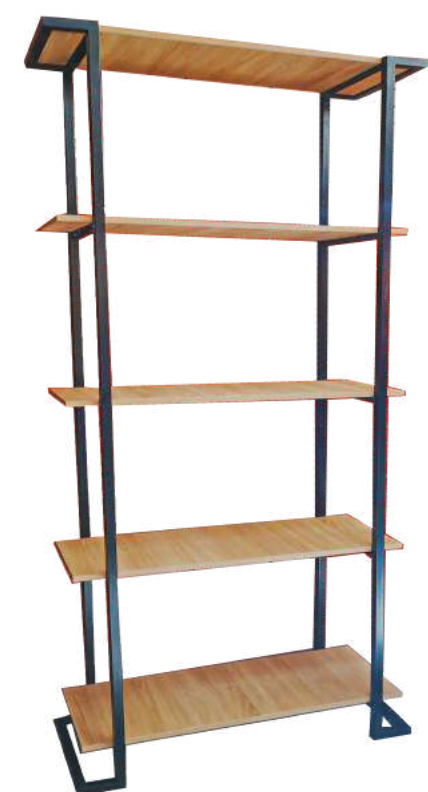
▶ Estante con diseño en madera