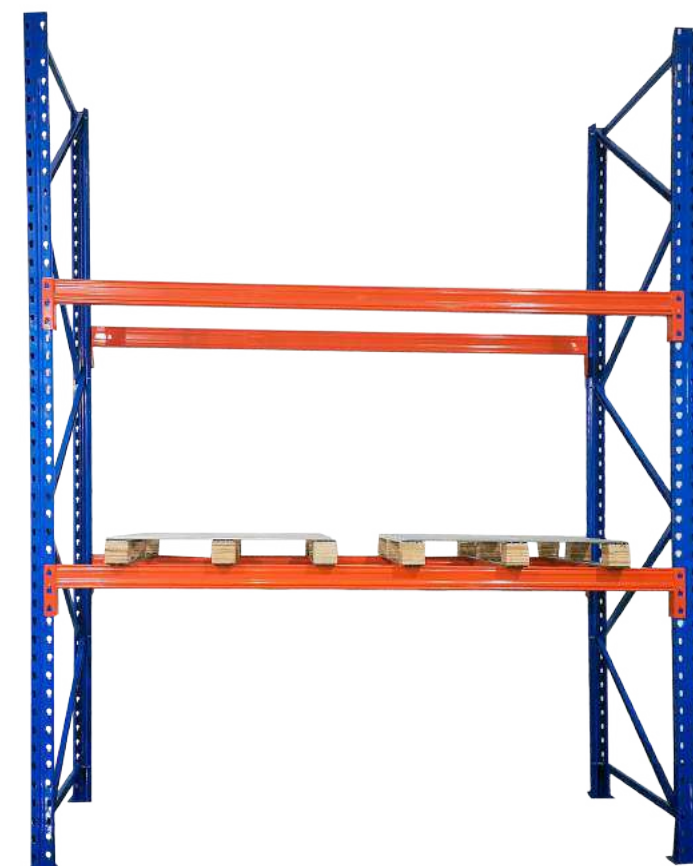
▶ Estantería pesada