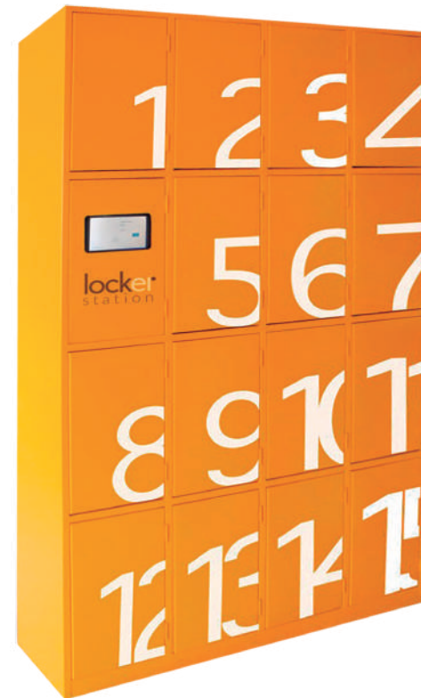
▶ Locker inteligente