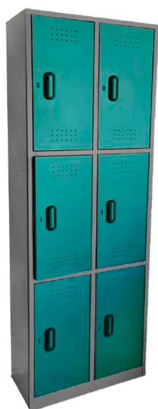
▶ Locker 6 puestos Vertical