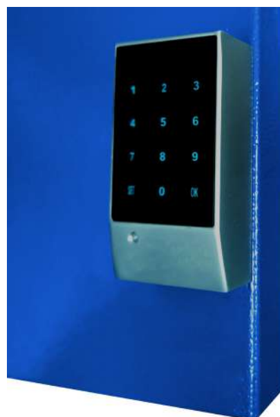
▶ Cerradura electrónica de panel táctil