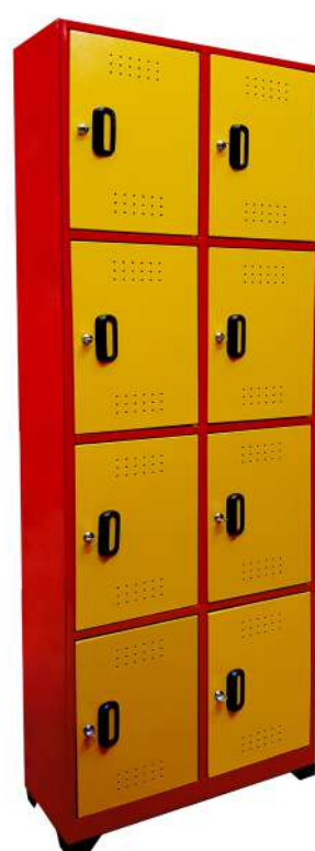
▶ Locker 8 puestos Vertical