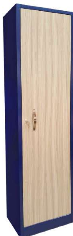
▶ Locker mixto madera-metal