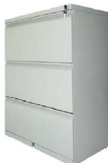
Archivador 3 Gavetas