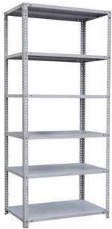
▶ Estantería liviana