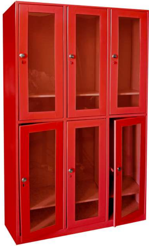
▶ Locker con puertas en acrílico