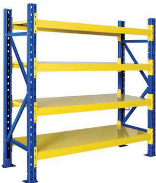
▶ Tendido en lámina de acero Cold Rolled