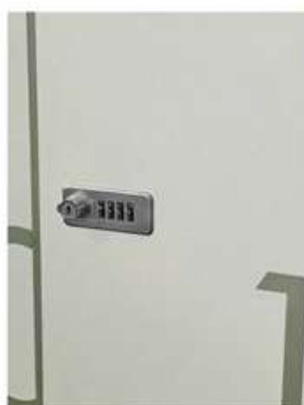
▶ Cerradura combinación numérica