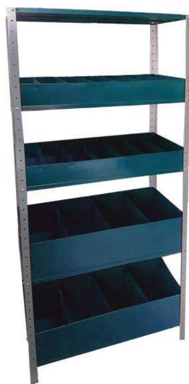
▶ Estante tornillero