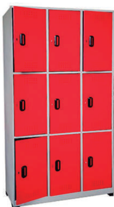
▶ Locker 9 puestos