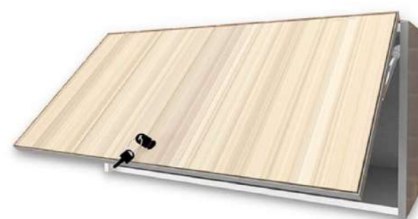
Archivador Aéreo Frente en Formica