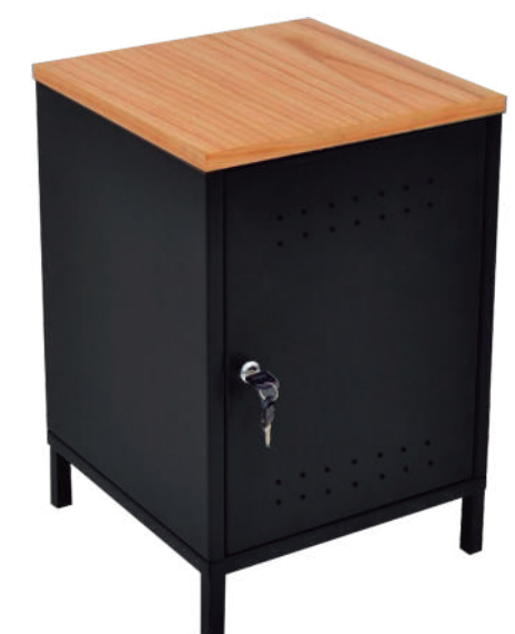
▶ Locker tipo mesa tapa en madera