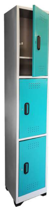
▶ Locker 3 puestos