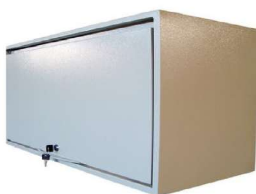
Archivador Aéreo Frente en lámina

Elaborado en lámina Cold Rolled Cal. 22, en pintura electrostática horneable de alta resistencia.