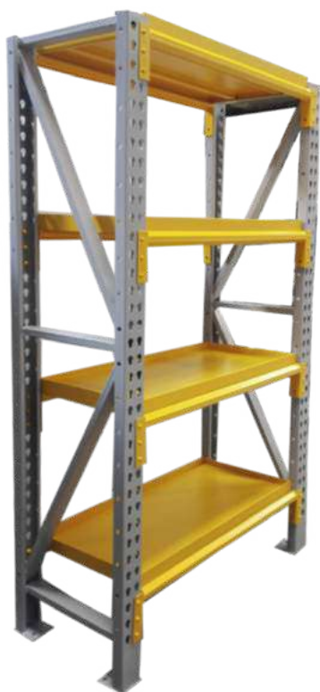
▶ Estante con bandejas de retención de líquidos