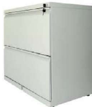
Archivador 2 Gavetas

Elaborado en lámina Cold Rolled Cal. 22 , chapa de seguridad.