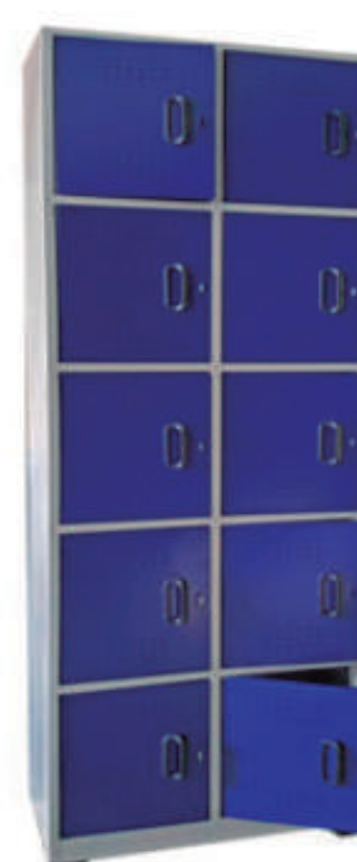
▶ Locker 10 puestos Vertical