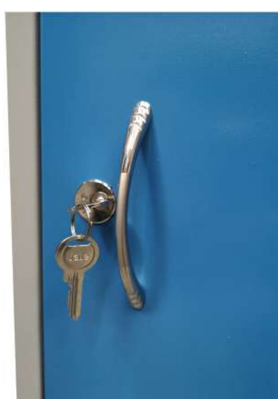
▶ Cerradura de llave