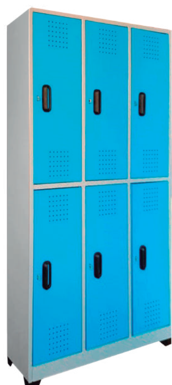
▶ Locker 6 puestos Horizontal